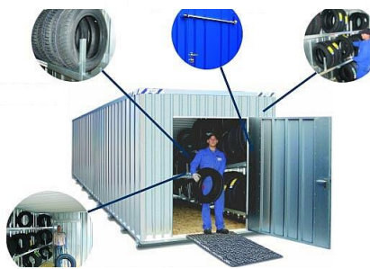
36 m linéaire de rangement pour vos pneus