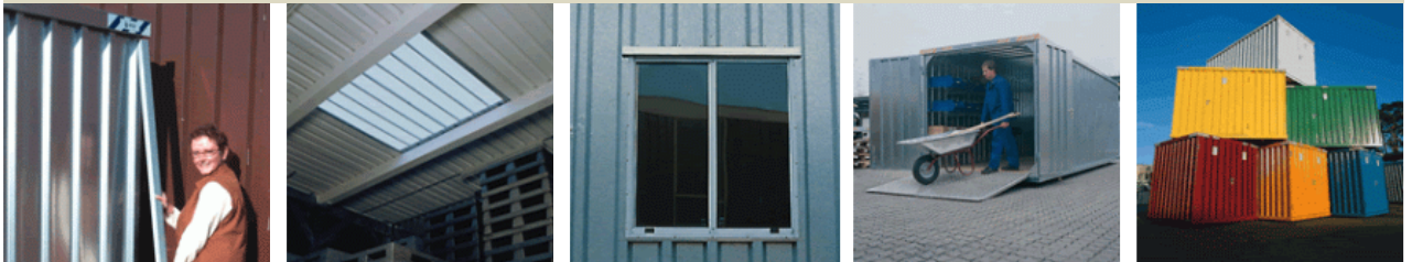
Protection d'angle, verrière, fenêtre, rampe d'accès et couleur à votre choix.

Une question, un devis, Contactez nous au 0033(0) 604 190 553