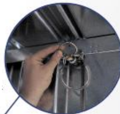
Système de fixation rapide (montage)