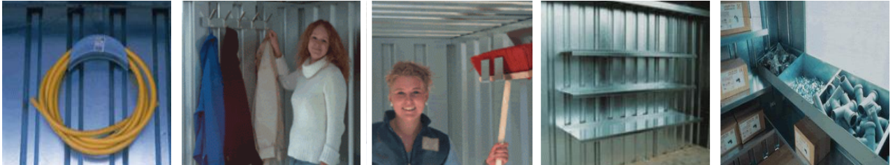
Enrouleur de tuyaux, rack à outils, porte manteaux, étagères et casiers facile a monter et totalement modulaires