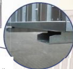
Prise pour chariot élévateur (Isolation du plancher et sécurité)