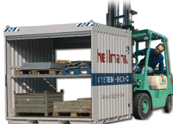
Barre de sécurité