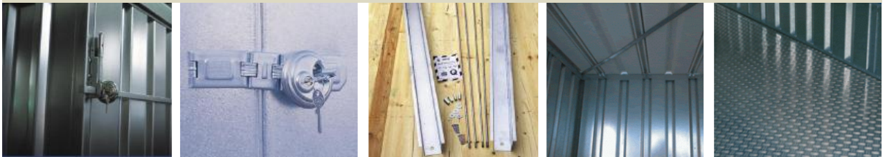
Barre anti effraction, verrou de sécurité, renforts de structure, toiture anti condensation et sol en acier galvanisé .