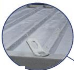
Anneaux de levage 6 tonnes